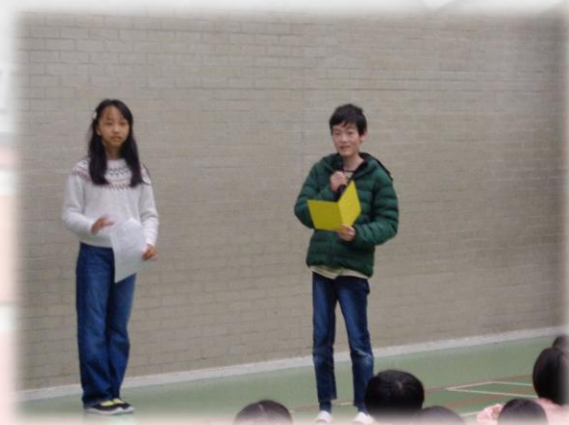
6年生代表児童 挨拶