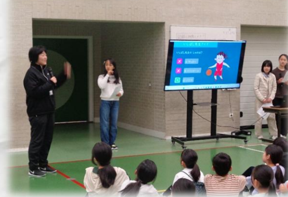
回答を詳しく解説