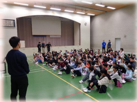
クイズに答えています