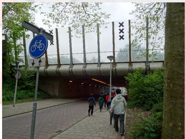
高速道の下をくぐって