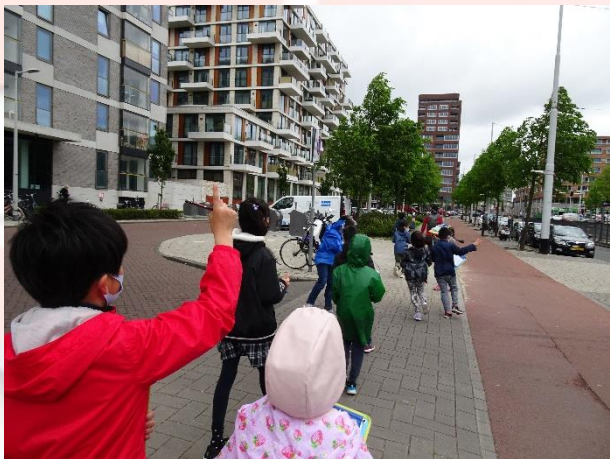
学校の東側 「会社かな？いろいろな建物がある」

今日は、小学部 3 年生の町探検の様子をご紹介します。 町探検は 2 回に分けて行われますが、今日は学校の東側コースでレンブラント公園方面の探検です。 町の様子を道路や建物の手掛かりに考えながら探検しました。