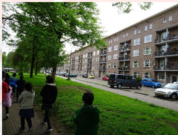
公園の近くにマンションがたくさんある！