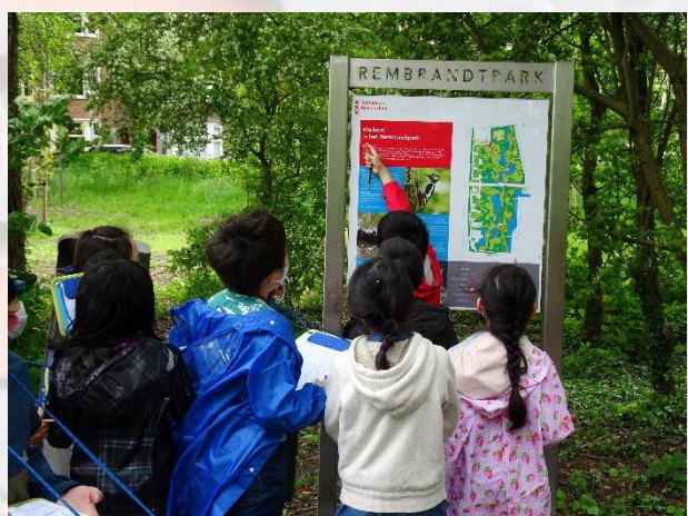
レンブラント公園の案内地図