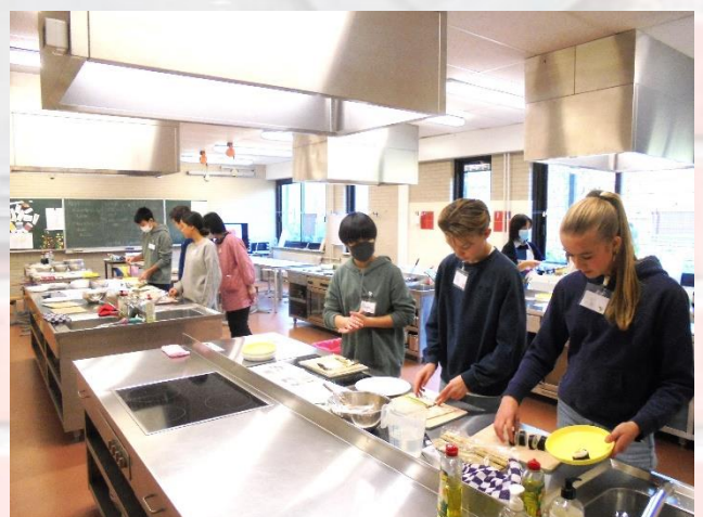
交流活動 「日本語教室」「和太鼓」「書道」「お寿司づくり」