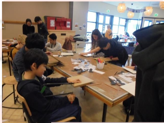
水門を工作しました