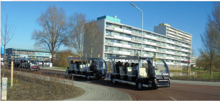
シャトルバスで市内観光へ