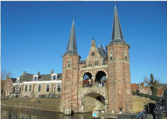
スネークの有名な水門