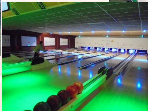
放課後 ボーリングを楽し みました