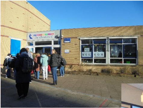
アウトファールト校に着きました

今日は、小学部6年生がアウトファールト校を訪問しました。2日間の交流初日は、大歓迎で迎えられました。スネークの町紹介や学校案内、町のシンボルである水門の工作、シャトルバスで街探検、ボーリングなど活動を楽しみました。