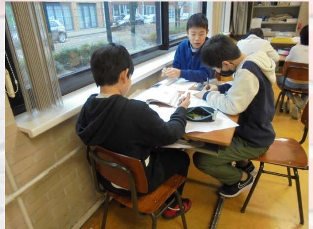
小学部6年生 算数のまとめ