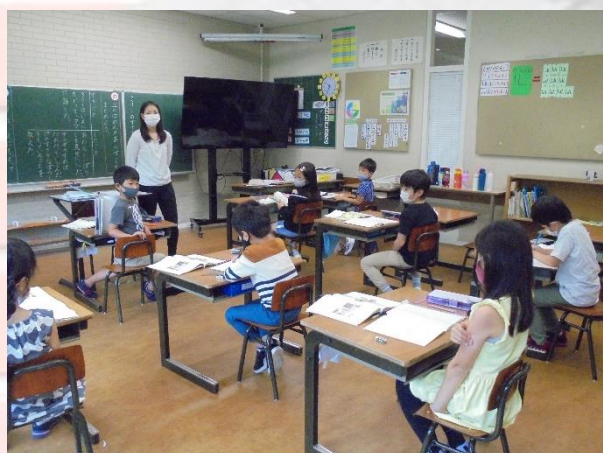
国語 あらすじをまとめよう 小学部2年1組