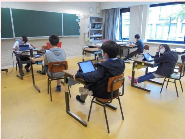
小学部6年生 総合的な学習 SDGSについて

今週は、個別懇談会のため3校時授業を行っています。学習はどの教科もまとめやこれまでの学習を活かした発展的な学習をしている学級が多いです。小学部6年生においては、2学期に行われる学習発表会に向けた調べ学習を行っていました。