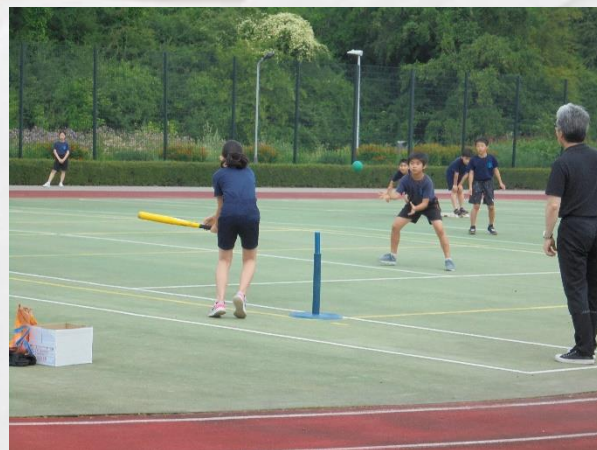
小学部5年生 体育 Tボール 狙いを定めてヒットを打ちました！