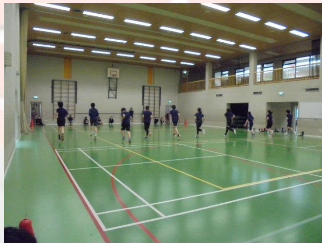
中学部 体育 「シャトルラン」