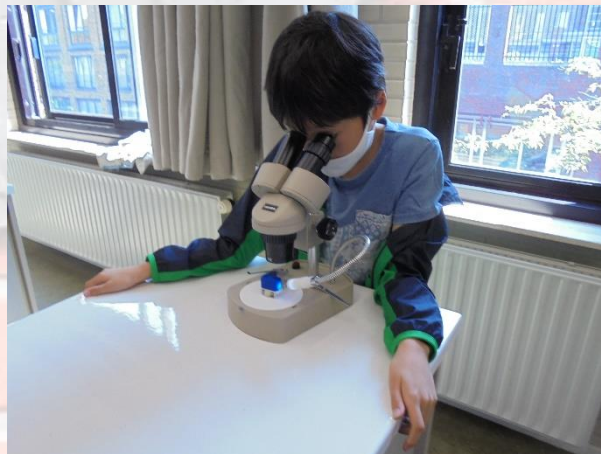
小学部5年生 理科 「顕微鏡の使い方」