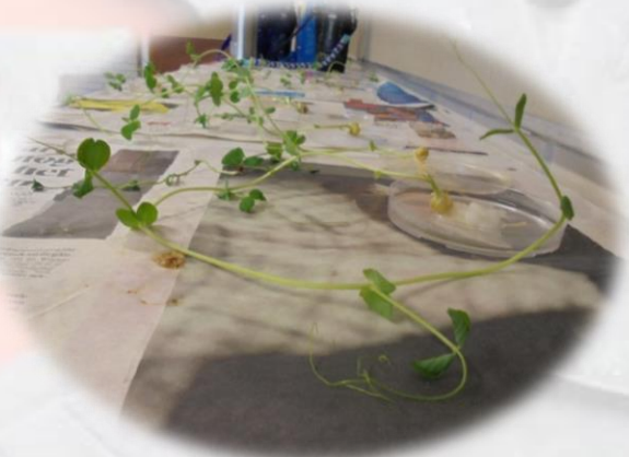
小学部5年生 「インゲン豆の発芽」 学習のまとめ

考察 種子にヨウ素液をかけると、青むらさき色に変化したため、種子の中には発芽に必要な養分が含まれていると考えられる。種子だったものにヨウ素液をかけると変化がなかったため、成長したすると種子だったものの中には養分がほとんど含まれていないといえる。 ヨウ素液をかけると、種子の断面は色が青っぽくなり種子だったものは、変化しなかったから、種子の中に必要な養分が含まれていて、発芽したあとの種子は、発芽に養分を全部使いきったため、養分が含まれていないといえる。