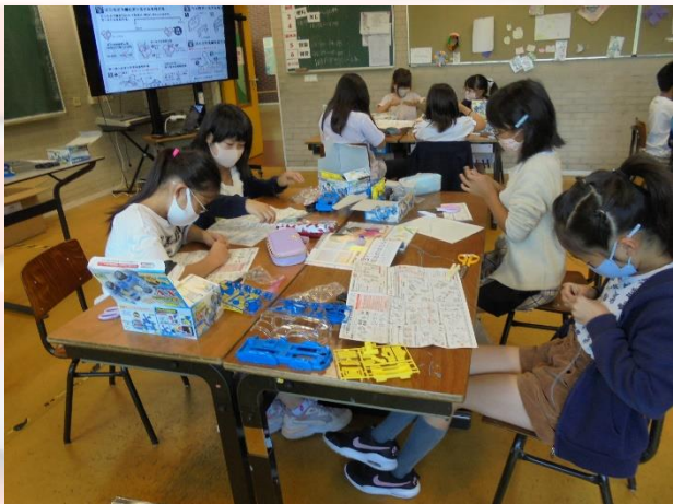
小学部4年生 理科 「電気で走る車」製作

今日もカラッと晴れたいいお天気になりました。明日の本番に向けて、準備が着々と進んでいます。今日は、小学部4年生と5年生の理科の学習の様子をご紹介します。4年生は「電気で走る車」をこれまでの学習を生かして製作していました。5年生は「植物に発芽」についてまとめ、その後教室を移動して顕微鏡の使い方を学習していました。