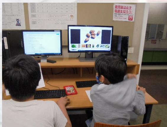
小学部4年生 理科 ゴーヤの種や実について調べ学習