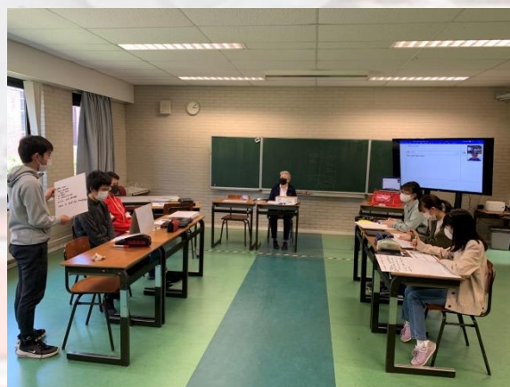
中学部3年生 英語 「It's Debatable」