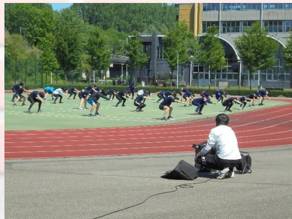
中学部 体育 「彩」のフォーメーションの確認と練習の様子