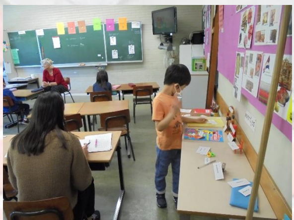
小学部2年1組 NL カードを探す