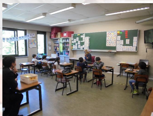
小学部2年1組 1～20までの発音練習