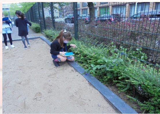
季節と生き物の観察