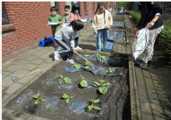
小学部4年生 学級園のお世話

今日は、小学部4年生の栽培活動と6年生のELでの自己紹介プレゼンの様子を掲載します。4年生は、先週末学級園にズッキーニの苗を植えていましたが、3日間間が空いたので、お世話を空いていました。また、季節の生き物や草花の観察も行っています。6年生は、名前や好きなこと、好きな食べ物などをカードを提示し、プレゼンしました。