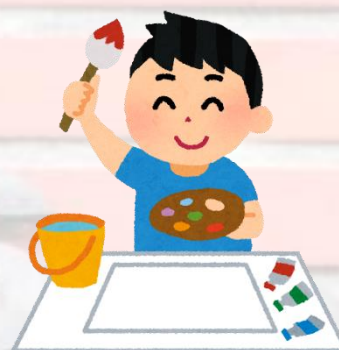
小学部3年生 図工 グラデーション