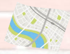
小学部4年生 社会 地図帳を使って調べ学習