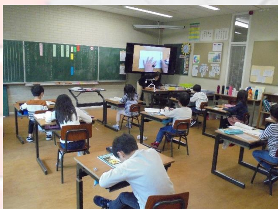
2年1組 日記の書き方の学習 実物投影機を使って、ノート指導