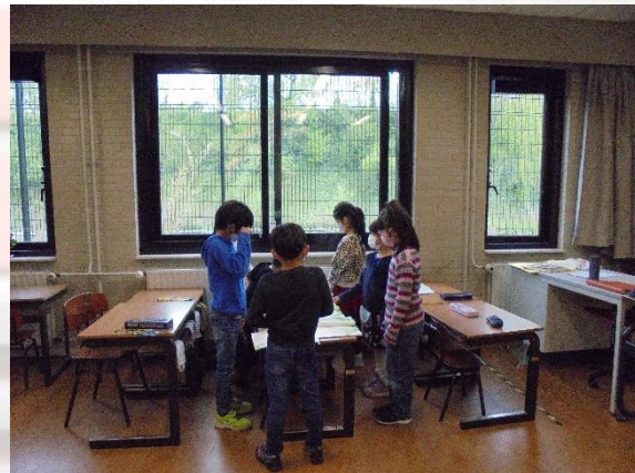
小学部2年2組の2つのグループに分かれて「ふきのとう」音読練習