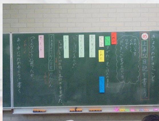
学習の進め方（板書より）