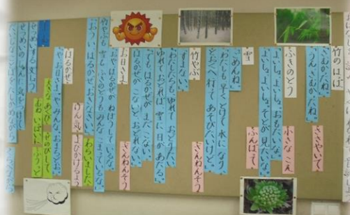
ふきのとうの会話文