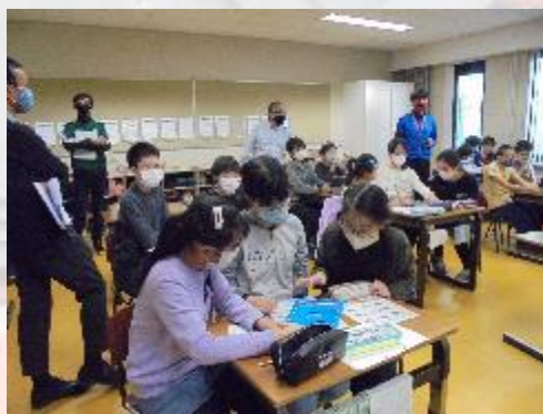
小学部6年生 外国語の研究授業の様子②