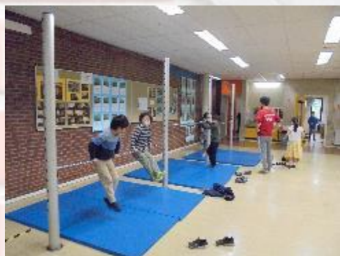
小学部1年生 休み時間の様子(新ホール)②