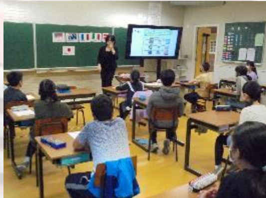
小学部6年生 外国語の研究授業の様子①