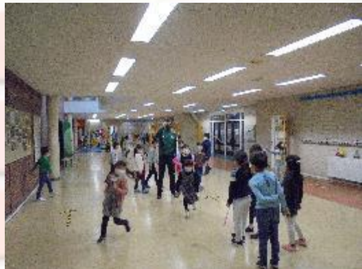
小学部1年生 休み時間の様子(新ホール)①

本日は、小学部6年生において外国語科の研究授業を実施しました。社会科の学習と関連付けて、ICT機器を活用しながら英語で学び合い学習を進めました。