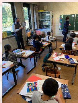
小学部1年生 研究授業の様子③