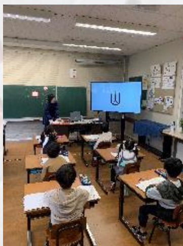
小学部1年生 研究授業の様子⑤