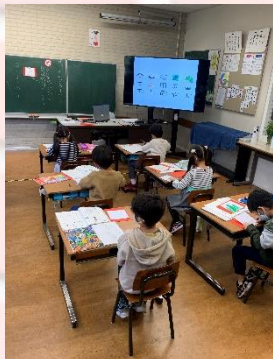
小学部1年生 研究授業の様子①

本日、小学部1年1組で国語の研究授業が行われました。漢字の成り立ちの映像を見て気が付いたことを発表した後に、できかたがわかるカードを意欲的に作りました。