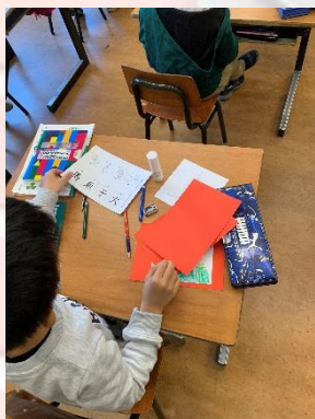
小学部1年生 研究授業の様子②