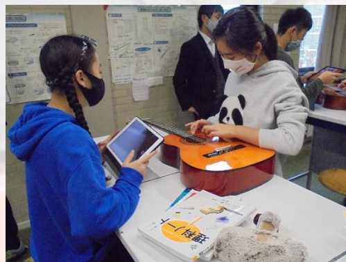
中学部1年生 理科の研究授業の様子②