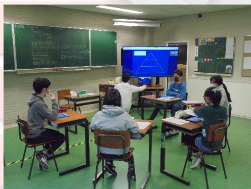
中学部2年生 道徳の研究授業の様子②