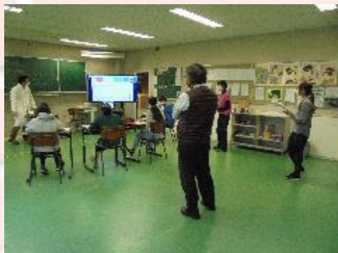
中学部2年生 道徳の研究授業の様子①

本日は中学部2年生の道徳と中学部1年生の理科の研究授業が実施されました。どちらもICT機器を使って話し合い活動を展開し、学習を深めることができました。