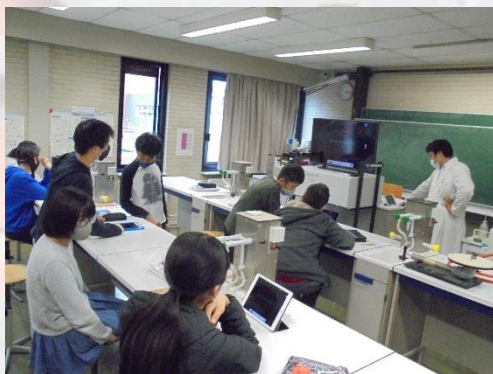
中学部1年生 理科の研究授業の様子③