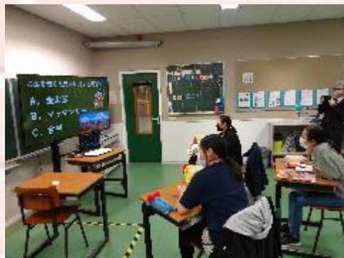
中学部3年生 研究授業の様子①

本日は中学部3年生の社会科の研究授業が実施されました。本校では「児童生徒をつなぐ学び合い」～ICT機器の活用・確かな学力の向上を目指して～をテーマに授業研究を実践しています。