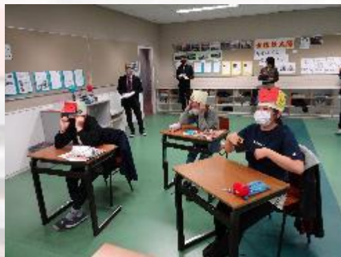
中学部3年生 研究授業の様子③