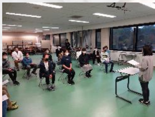
中学部全学年 生徒会役員会の立会演説会の様子