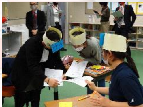
中学部3年生 研究授業の様子②