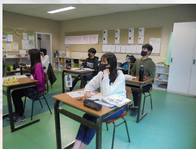
中学部3年生 社会 公的扶助について