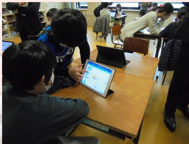
小学部5年生 算数 プログラミング