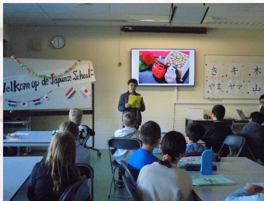
小学部6年生による日本の紹介