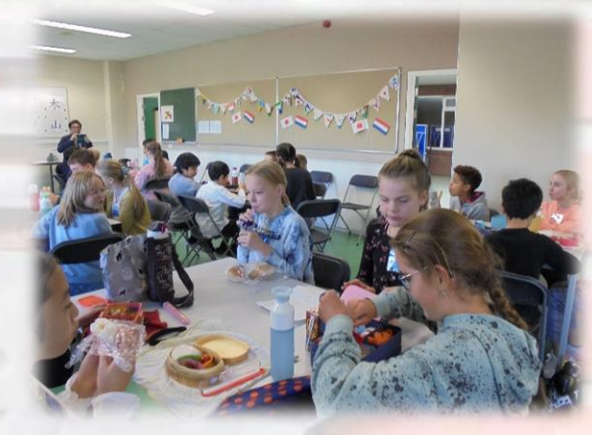
午後の交流活動は日本語、日本の遊び、習字などを通して交流を深めました