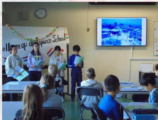
小学部5年生による日本の紹介