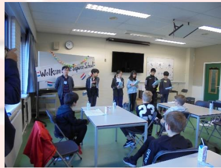
アウトファールト校の皆さんを歓迎している様子