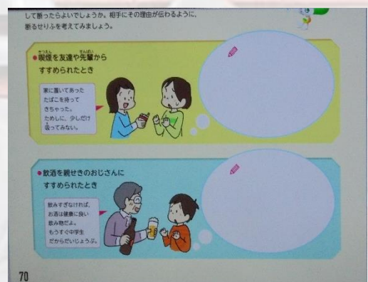
「飲酒と喫煙」あなたならどうやって断る？