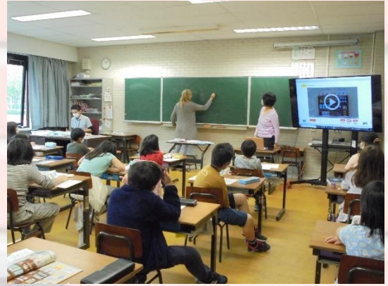
「Do you have~?」「Yes,I do」「No,I don't」