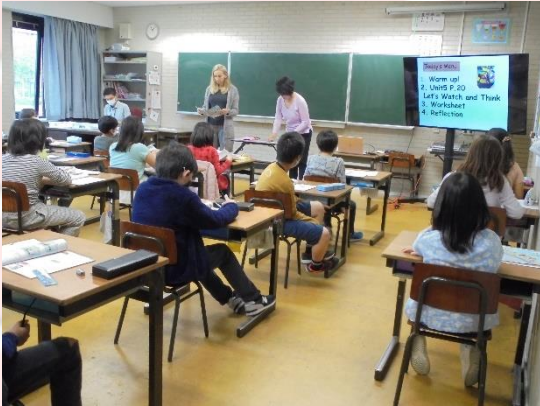
小学部4年生 外国語活動

今日は、小学部4、6年生と中学部の学習の様子をお知らせします。小学部6年生では、昨日に引き続き、保健体育で「飲酒と喫煙」に関する授業が行われ、飲酒や喫煙に誘われた時どう対処するかロールプレイで学びを深めていました。