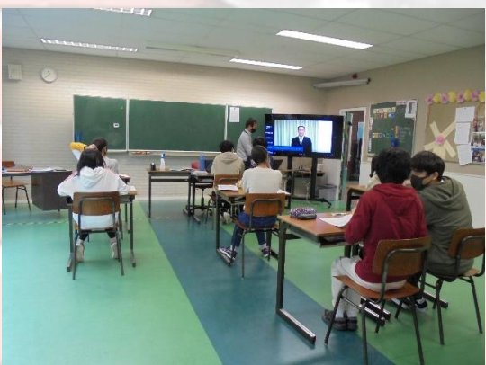
中学部3年生 進路指導 面接について