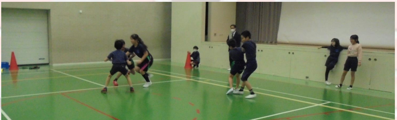
小学部4年生 体育 フラッグフット