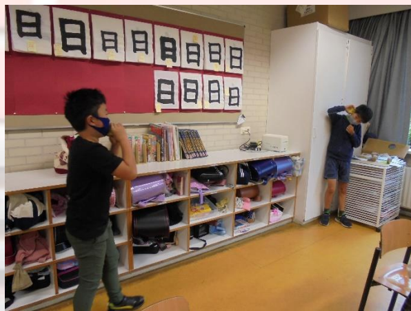
小学部3年 理科 音の伝わり方